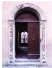
Istituto storico della resistenza e dell'età contemporanea in Forlì e Cesena